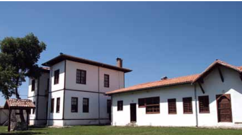
İsmet Eker Kırsal Yaşam Tarım Müzesi, Çorum İsmet Eker Rural Life Agricultural Museum, Çorum