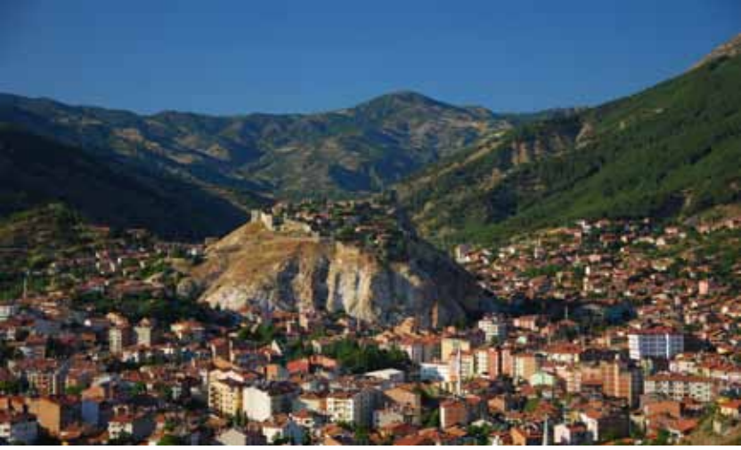
İskilip Kalesi İskilip Castle