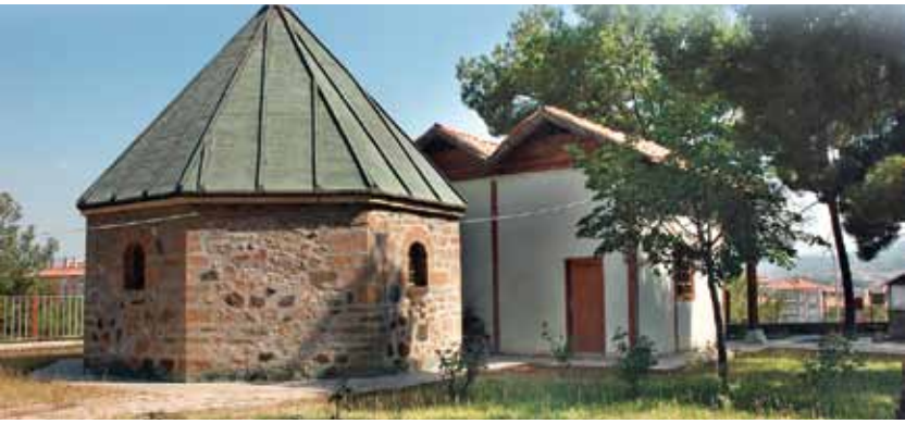
Osmancık Koyunbaba Türbesi Osmancık Koyunbaba Mausoleum