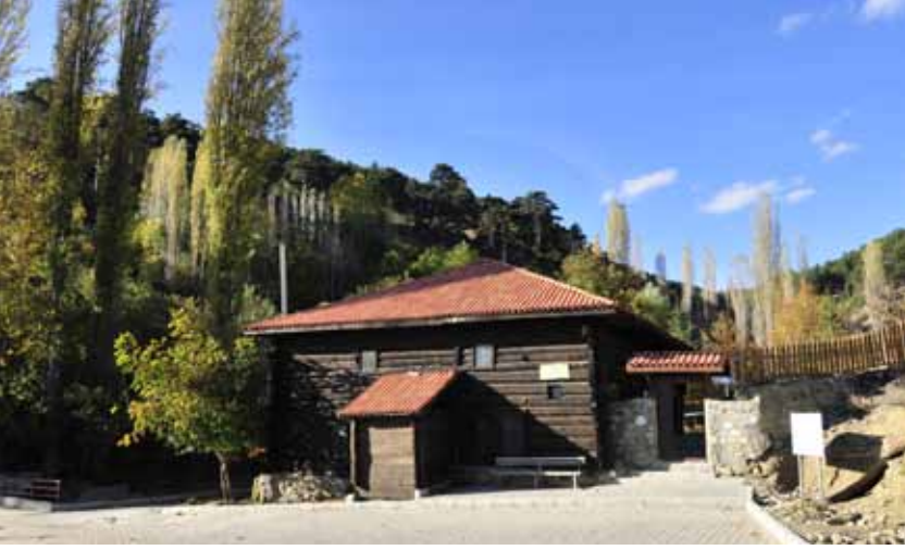
İskilip Yivlik Akşemseddin Hz. Camii ve Türbesi İskilip Yivlik Akşemseddin Hz. Mosque and Tomb