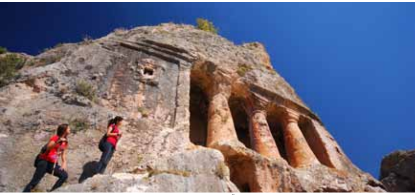
Gerdekkaya Mezarı, Alaca Geven Köyü /M.Ö. 2. yüzyıl (Hellenistik Dönem) Gerdek Rock Tomb, Alaca Geven Village / 2. Century (B.C.) Hellenistic period.