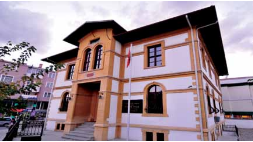
Çorum Hasanpaşa Yazma Eserler Kütüphanesi Çorum Hasanpaşa Manuscripts Library