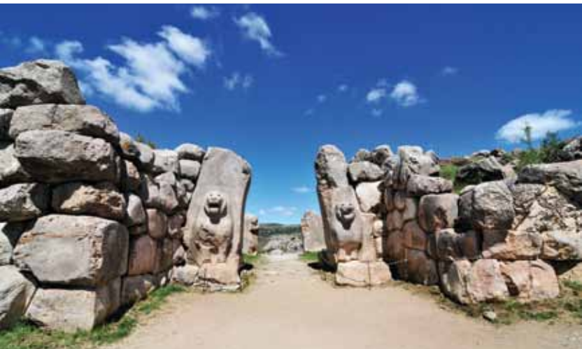
Aslanlı Kapı, Hattuşa (M.Ö. 1300) / Lion Gate, Hattusha (1300 B.C.)

Hattusa is one of the 15 values in Turkey, which UNSECO added in the Worls Heritage List. It is 83 km from Çorum and 180 km from Ankara. It was surrounded by a six-kilometre city wall in the Hittite Empire. This city wall houses monumental city gates. These are the Lion Gate, King Gate and Ground Gate, 71 meter long and 3 meter wide in the southern end of the city. Hattusa is not only the governmental capital of the Hittite Empire but also the religious centre of the country.