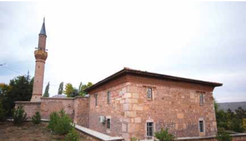
Elvançelebi Türbesi Elvançelebi Mausoleum