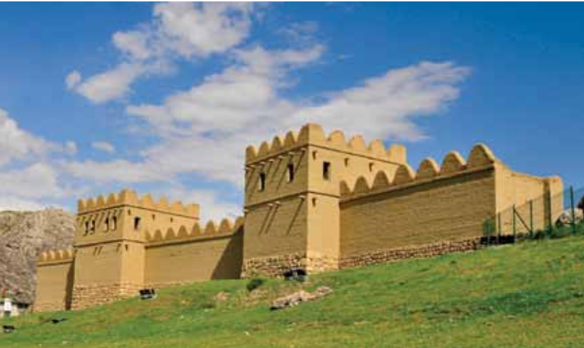
Hitit Sur Rekonstrüksiyonu Reconstruction of the Hittite walls

Hattuşa, UNESCO'nun Türkiye'de Dünya Mirası Listesi'ne aldığı 15 değerden biridir. Çorum'a 83, Ankara'ya ise 180 kilometre uzaklıktadır. Hitit İmparatorluk döneminde altı kilometre uzunluğunda surla çevrilmiştir. Bu sur üzerinde anıtsal şehir kapıları bulunmaktadır. Bunlar, Aslanlı Kapı, Kral Kapı ve kentin güney ucunda 71 metre uzunluğunda ve 3 metre yüksekliğindeki Yer Kapıdır. Hattuşa, Hitit İmparatorluğu'nun yalnızca idari başkenti değil, aynı zamanda ülkenin de dini merkezidir.