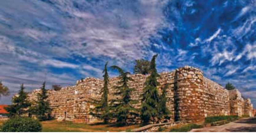
Çorum Kalesi Çorum Castle