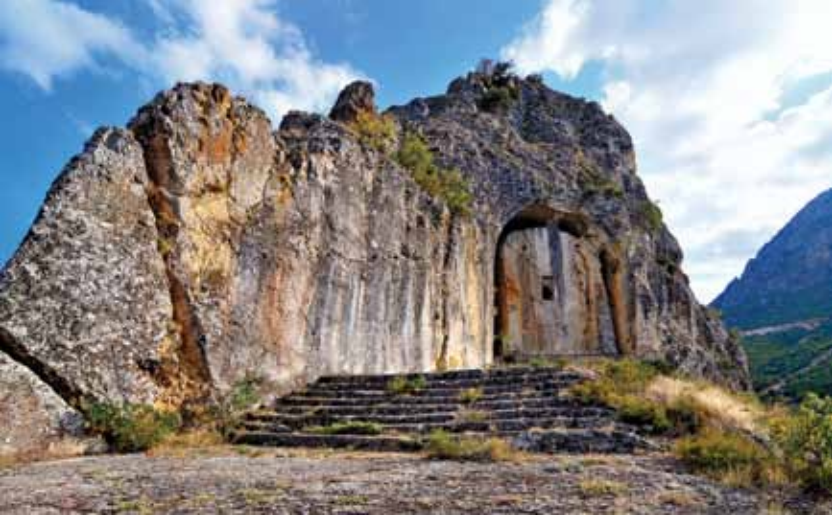
Kapılıkaya Kaya Mezarı, Laçin/ Hellenistik Dönem Kapılıkaya Rock Tomb, Laçin / Hellenistic Period