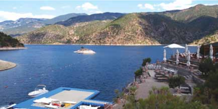
Obruk Baraj Gölü / Oğuzlar Obruk Lake / Oğuzlar