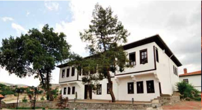
Tarihi Dulkadiroğulları Konakları, Boğazkale Historical Dulkadiroğulları Mansions , Boğazkale