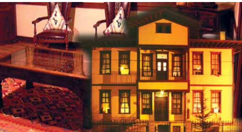
Velipaşa Konağı, Çorum Veli Pasha Residence, Çorum