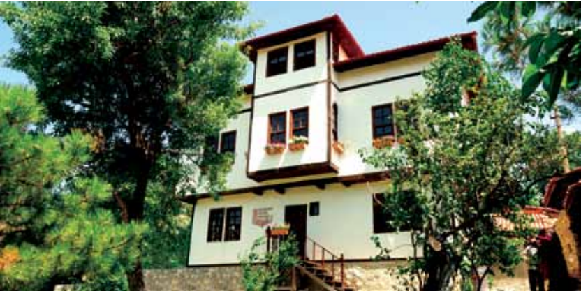
İskilip Çatalkara Kültür Sanat Evi İskilip Çatalkara Cultural and Art House