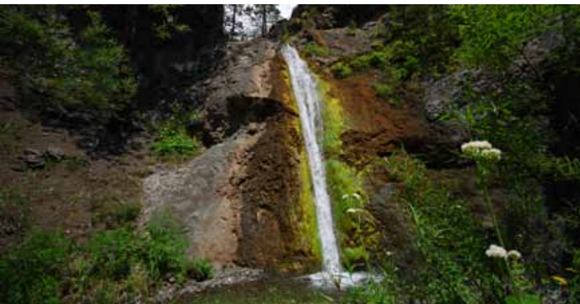
Karayanık Şelalesi Karayanık Waterfall