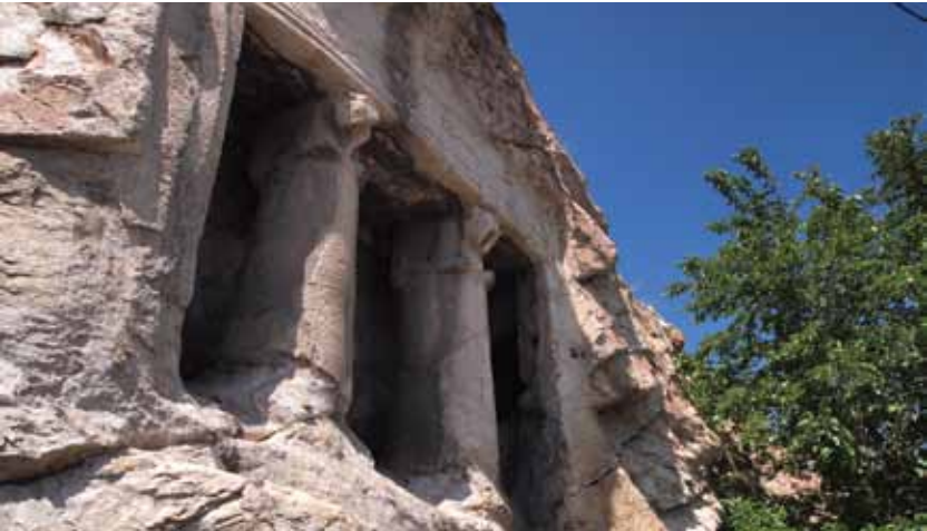
İskilip Kaya Mezarları İskilip Rock Tombs