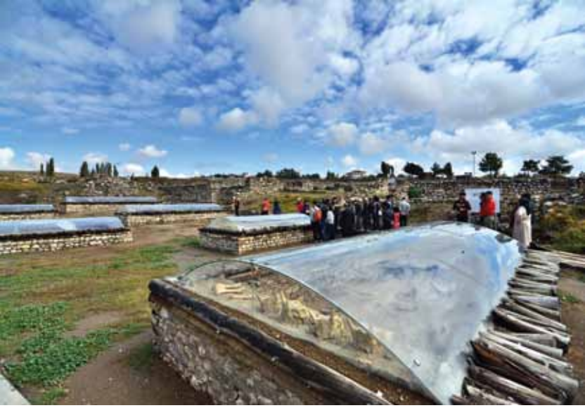
Alacahöyük Eski Tunç Çağı hanedan mezarları Dynastic graves of Alacahöyük, (Early Bronze Age)