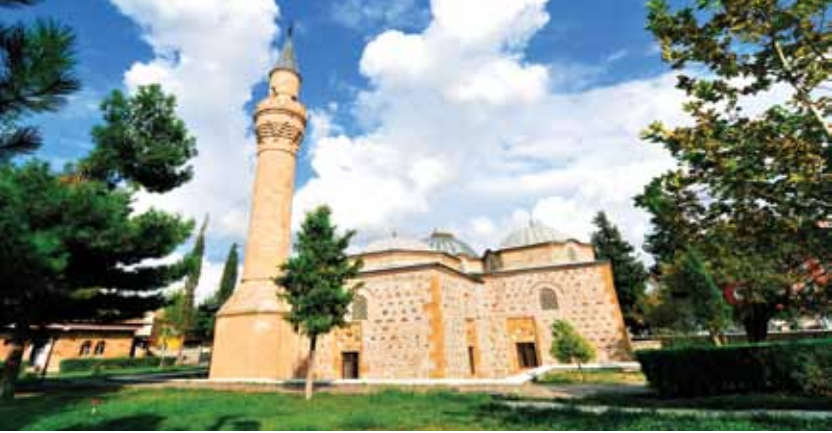
Osmancık İmaret Camii Osmancık İmaret Mosque