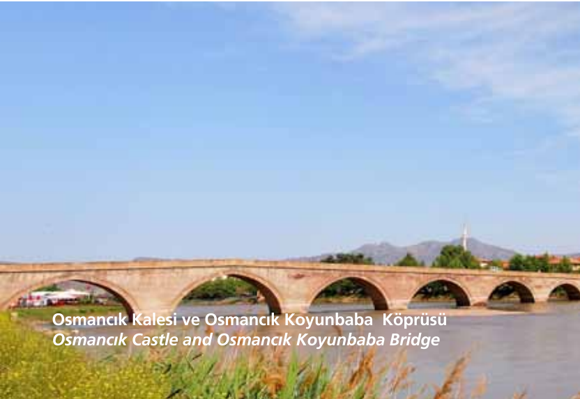
Osmançık Kalesi ve Osmançık Koyunbaba Köprüsü Osmançık Castle and Osmançık Koyunbaba Bridge

Orta Anadolu'nun, 1071'de kazanılan Malazgirt savaşıyla Selçuklu hâkimiyetine girmesinin ardından Çorum ve çevresi, Danişment Ahmet Gazi tarafından 1075 yılında Türk hâkimiyetine alınır. Camileri, kaleleri, saat kulesi ve köprüsü ile Çorum, Beylikler ve Osmanlı Döneminin izlerini günümüze kadar taşımıştır. Çorum'da Hıdırlık Mevkiinde Hıdırlık Camii ve Sahabe Türbeleri yer almaktadır. Selçuklu dönemi yapılardan olan Ulu Cami ise şehir merkezindedir.