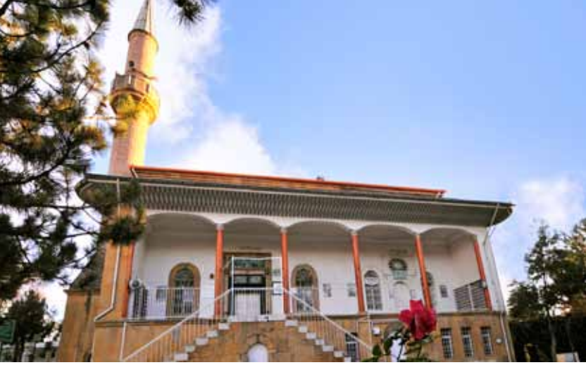
Hıdırlık Camii ve Sahabe Türbeleri Hıdırlık Mosque and Sahaba Mausoleums